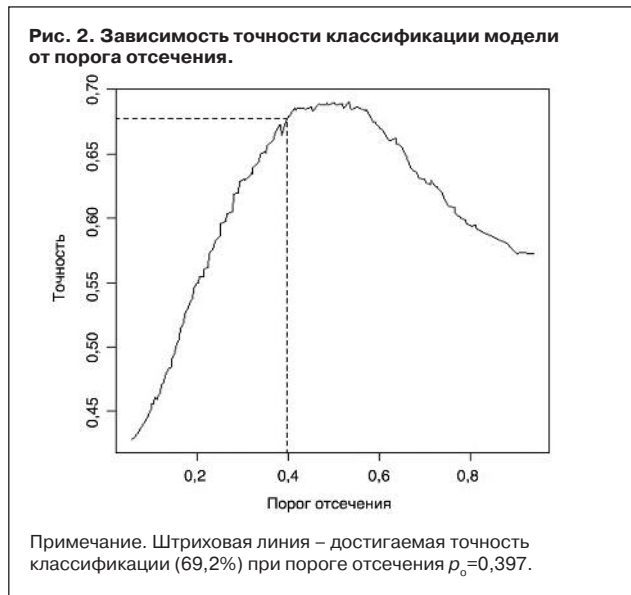
Рис. 2. Зависимость точности классификации модели от порога отсечения.

Примечание. Штриховая линия – достигаемая точность классификации (69,2%) при пороге отсечения p_0 = 0,397 .